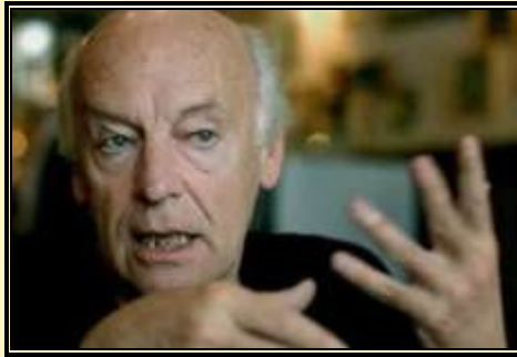
Eduardo Hughes Galeano

“No por nada fue el libro escogido por el Presidente venezolano Hugo Chávez, para regalarle a presidente Barack Obama en la cumbre de las Américas en Trinidad y Tobago el año 2009”.