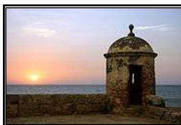
Cartagena, Colombia, declarada Patrimonio de la Humanidad - Unesco en 1985

El término «Latinoamérica» tiene un sentido de supra-nacionalidad respecto de los estados-nación. Dicho sentido supra-nacional confluye en diferentes iniciativas comunes que tienden a la formación de organismos políticos que lo articulen, como la Comunidad Sudamericana de Naciones actualmente constituida en UNASUR/UNASUL y en pleno proceso de aprobación a nivel de tratado por los congresos respectivos. La Unidad Latinoamericana es un concepto político-cultural extendido por América Latina anterior a los tiempos de la independencia, y que debe ser distinguido claramente del panamericanismo. Partidos políticos, sectores sociales, intelectuales y artistas de las más diversas extracciones han expresado reiteradamente su adhesión a las más diversas formas de unidad latinoamericana, desde organizaciones supranacionales como la Asociación Latinoamericana de Integración ( ALADI ) hasta instancias de coordinación política como la Conferencia Permanente de Partidos Políticos de América Latina ( COPPAL ), culturales como la Unión de Universidades de América Latina y el Caribe ( UDUAL ) o sectoriales que adoptan la forma de uniones latinoamericanas.