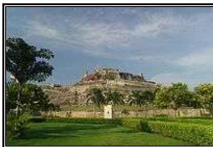
Fortaleza de Cartagena en Colombia