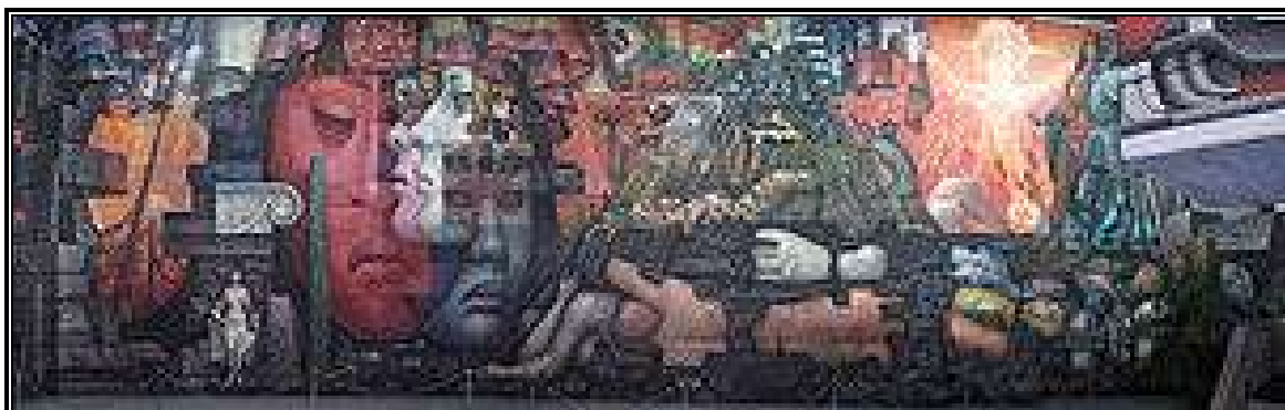
Obra Presencia de América Latina, del muralista mexicano Jorge González Camarena.

A comienzos del siglo XX, el arte latinoamericano se inspiró mucho en el movimiento constructivista ruso. Se atribuye a Joaquín Torres García y Manuel Rendón la importación del movimiento constructivista a Latinoamérica desde Europa.