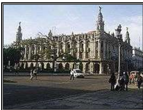
Gran Teatro de La Habana

El cine mexicano en su edad dorada de los 1940s presumía de una industria comparable a la del Hollywood de su tiempo. Con estrellas como María Félix, Dolores del Río, Pedro Infante, Jorge Negrete o Cantinflas y directores como el español Luis Buñuel. En los años 1970 México fue la localización de muchas películas de acción y de horror. Recientemente el cine mexicano ha resurgido con películas como Amores Perros (2000) y Y tu mamá también (2001) que han llevado a sus directores Alfonso Cuarón y Alejandro González Iñárritu a Hollywood. Alejandro González Iñárritu dirigió en (2006) Babel y Alfonso Cuarón dirigió Children of Men en (2006) y Harry Potter and the Prisoner of Azkaban en (2004). El también mexicano Guillermo del Toro y su íntimo amigo y director destacado de Hollywood, dirigió El laberinto del fauno (2006) y produjo El Orfanato (2007). Carlos Carrera ( El crimen del padre Amaro ), y el guionista Guillermo Arriaga son también conocidos cineastas mexicanos.