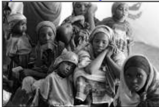
"Exhausted Darfuri refugees in eastern Chad Photo by Mark Brecke."

http://www.sudanreeves.org/Article174.html