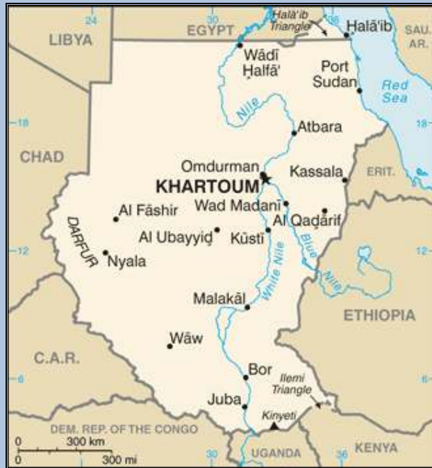
Mapa de República de Sudán

https://www.cia.gov/library/publications/the-world-factbook/geos/su.html