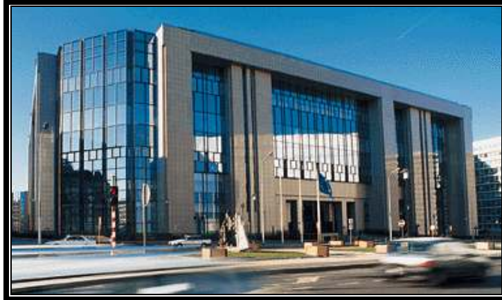
"Edificio del Consejo de la Unión Europea en Bruselas"

Comentarios y sugerencias: yake_diplomatic@mexicodiplomatico.org Para: www.mexicodiplomatico.org