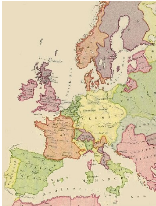
MAPA DE EUROPA DEL SIGLO XVI

El centro del comercio europeo estaba en Antwerp (Países Bajos). Con el comienzo de las disputas por la religión en contra de Felipe II, este centro lentamente se fue cambiando hacia Londres. Muchos protestantes de los Países Bajos se trasladaron hacia Inglaterra para buscar refugio y con ellos trajeron las enseñanzas de la artesanía y de la industria, habilidades que rápidamente los ingleses aprenderían.