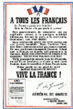
Cartel posterior al discurso de De Gaulle: "¡Francia ha perdido una batalla, pero no la guerra!"

Los líderes que, desde hace muchos años, están a la cabeza de los ejércitos franceses, han formado un gobierno. Este gobierno alegando la derrota de nuestros ejércitos, se ha puesto en contacto con el enemigo para el cese de las hostilidades.