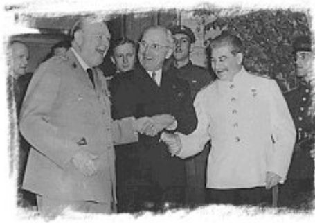
Churchill, Truman y Stalin

1. Nosotros, Presidente de los Estados Unidos de América, Presidente del Gobierno Nacional de la República de China y Primer Ministro de la Gran Bretaña, re presentando a centenares de millones de nuestros compatriotas, conferenciamos y convinimos que debe darse una ocasión al Japón para poner término a la presente guerra.