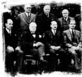
El gabinete de guerra británico formado en 1940, en el centro sentados: Churchill y Atlee

Debemos recordar que estamos en las fases preliminares de una de las grandes batallas de la historia, que nosotros estamos actuando en muchos puntos de Noruega y Holanda, que estamos preparados en el Mediterráneo, que la batalla aérea es continua y que muchos preparativos tienen que hacerse aquí y en el exterior. En esta crisis, espero que pueda perdonárseme si no me extiendo mucho al dirigirme a la Cámara hoy. Espero que cualquiera de mis amigos y colegas, o antiguos colegas, que están preocupados por la reconstrucción política, se harán cargo, y plenamente, de la falta total de ceremonial con la que ha sido necesario actuar. Yo diría a la Cámara, como dije a todos los que se han incorporado a este Gobierno: «No tengo nada más que ofrecer que sangre, esfuerzo, lágrimas y sudor».