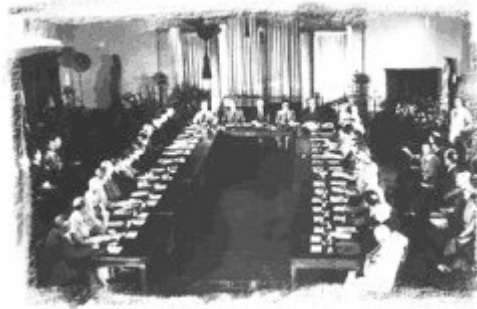
Conferencia de Dumbarton Oaks

Debería establecerse un organismo internacional con el nombre de Naciones Unidas, cuyo Estatuto contemplara las disposiciones necesarias para hacer efectiva las propuestas siguientes: