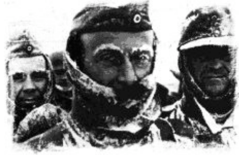
Soldados alemanes en Rusia Invierno 1941-1942