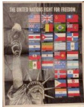
"Las Naciones Unidas luchan por la libertad"

Declaración conjunta de los Estados Unidos de América, el Reino Unido de la Gran Bretaña e Irlanda del Norte, la Unión de Repúblicas Socialistas Soviéticas, China, Australia, Bélgica, Canadá, Costa Rica, Cuba, Checoslovaquia, República Dominicana, El Salvador, Grecia, Guatemala, Haití, India, Luxemburgo, Países Bajos, Nueva Zelanda, Nicaragua, Noruega, Panamá, Polonia, Unión del Africa del Sur y Yugoslavia.