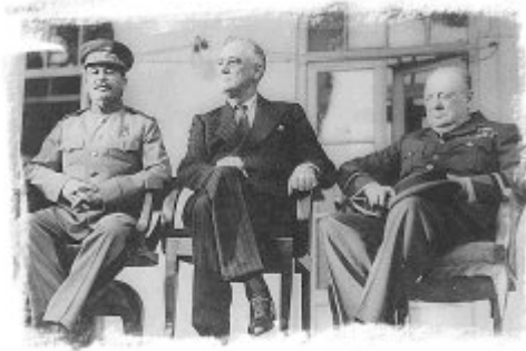
Stalin, Roosevelt y Churchill en la Conferencia de Teherán

Las Potencias participantes en la Conferencia han convenido: