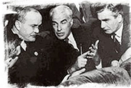
Los representantes de la URSS, EE.UU. y el Reino Unido en la Conferencia de San Francisco