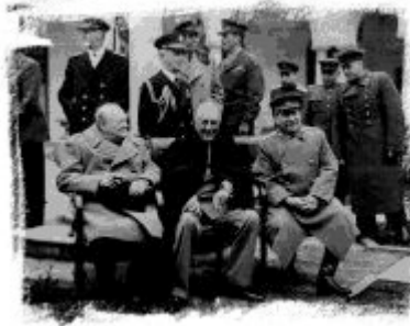
Churchill, Roosevelt y Stalin en Yalta

El Premier de la Unión de las Repúblicas Socialistas Soviéticas, el primer Ministro del Reino Unido y el Presidente de los Estados Unidos de América serán consultados en el interés común de los pueblos de sus países respectivos y de los de la Europa liberada. Afirman conjuntamente su acuerdo para determinar una política común de sus tres Gobiernos durante el período temporal de inestabilidad de la Europa liberada, con el fin de ayudar a los pueblos de Europa liberados de la dominación de la Alemania nazi, y a los pueblos de los antiguos Estados satélites del Eje, a resolver por medios democráticos sus problemas políticos y económicos más apremiantes.