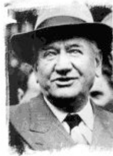
Edouard Daladier, primer ministro francés en septiembre de 1939