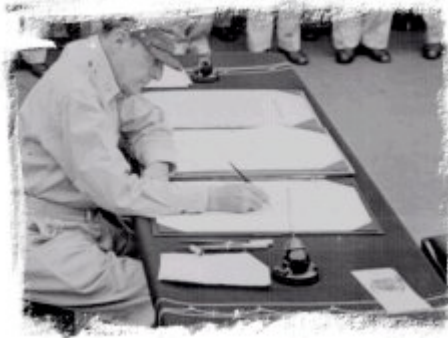
MacArthur firma la capitulación de Japón en el acorazado norteamericano Missouri

Obedeciendo las órdenes graciosas de Su Majestad el Emperador, que preocupado siempre de favorecer la causa de la paz mundial desea ardientemente poner fin rápido a las hostilidades para evitar a la humanidad las calamidades que le sobrevendrían con la prolongación por más tiempo de la guerra, el Gobierno japonés hizo un llamamiento hace algunas semanas a los buenos oficios del Gobierno soviético, con el cual mantenía entonces relaciones de neutralidad, para restablecer la paz entre el Japón y las potencias enemigas.