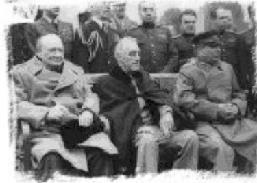
Churchill, Roosevelt y Stalin en Yalta