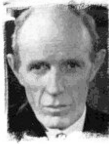
Lord Halifax, secretario del Foreign Office en 1939