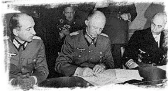
Oficiales alemanes firmando la capitulación en el cuartel general de Eisenhower en Reims