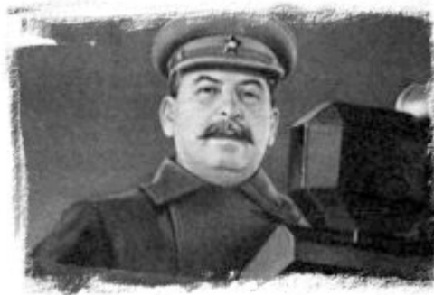
Stalin dirige un discurso radiofónico en 1941

¡Camaradas!, ¡Ciudadanos! ¡Hermanos y Hermanas! ¡Hombres de nuestro Ejército y nuestra Marina!. ¡Me dirijo a vosotros, mis amigos!