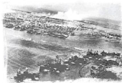
Pearl Harbor desde un avión japonés 7 de diciembre de 1941

Nos, Emperador de Japón por la gracia del cielo, hacemos saber que declaramos la guerra a los Estados Unidos de Norteamérica y al Imperio británico. La nación entera, con voluntad unida, movilizará todas sus fuerzas a fin de que nada sea olvidado para alcanzar nuestros objetivos de guerra.