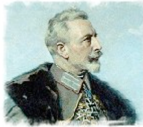
El Kaiser Guillermo II

"Alemania debe protestar ante la intención de Francia por apropiarse de Marruecos no solo por razones materiales, sino sobre todo para salvaguardar su prestigio. La posición a esgrimir al respecto sería la siguiente: la absorción abiertamente premeditada de Marruecos por Francia pone fin a la libre competencia extranjera y origina, por tanto, a los intereses de las terceras Potencias, y en particular de Alemania, un grave perjuicio ahora y en el futuro. Durante mucho tiempo creímos que Francia buscaría un acuerdo con las Potencias interesadas. Sin embargo, no ha sido así, al menos por lo que a Alemania se refiere.