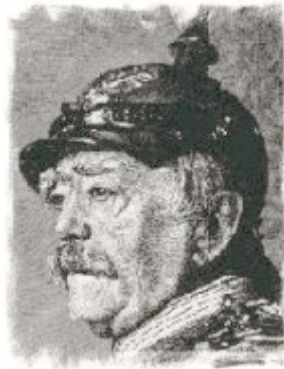
El Canciller Otto Von Bismarck

Sus Majestades, el Emperador de Austria, Rey de Bohemia, Rey apostólico de Hungría, el Emperador de Alemania, Rey de Prusia, y el Rey de Italia, animados por el deseo de aumentar las garantías de la paz general, de fortificar el principio monárquico y de asegurar con ello mismo el mantenimiento intacto del orden social y político en sus Estados respectivos, han acordado concluir un tratado que, en virtud de su naturaleza esencialmente conservadora y defensiva, no persigue otro objetivo que el de precaverles contra los peligros que pudieran amenazar la seguridad de sus Estados y la tranquilidad de Europa.