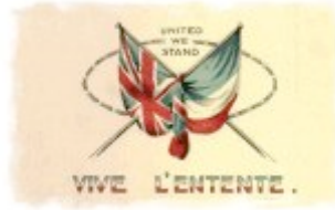
Cartel de propaganda de la Primera Guerra Mundial