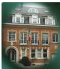
Embajada en Bélgica