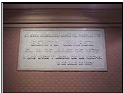
Placa en la habitación donde murió Benito Juárez . Ahora recinto a Juárez. Palacio Nacional de México.

Hubo un mes de solemnidades en todo el país en su honor.