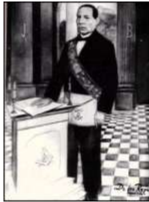
Gr.: Log.: de Edo.: " Benito Juárez "

independizarse del extranjero y se respiraba un gran nacionalismo en él.