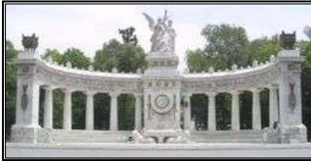
Hemiciclo a Juárez. En la Alameda Central de La Cd. de México

En la parte sur de la alameda de la Ciudad de México se encuentra el Hemiciclo a Juárez , gran monumento en mármol construido en su honor por Porfirio Díaz durante su mandato.