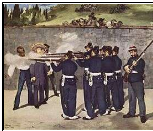
“Fusilamiento de Maximiliano, Miguel Miramón y Tomás Mejía en el Cerro de las Campanas”. (Édouard Manet)

En Nueva York, La familia Juárez dejan por fin la casa que habían ocupado allí por tanto tiempo y así Margarita, junto con sus hijos, su yerno, dos féretros con sus dos hijos finados y personal de la Embajada de México en E.U.A. parten en tren oficial del gobierno norteamericano rumbo a Washington. Allí son recibidos con gran júbilo y Margarita fue noticia de primera plana en los periódicos de entonces. Estuvieron allí tres semanas. Mr. Siward dijo al Embajador mexicano Matías que tenía informes de que Antonio López de Santa Anna planeaba secuestrar a Margarita por lo que se tomaron medidas respecto del itinerario que sería distinto en lo anunciado que lo realizado. Santa Anna tenía espías desde hace tiempo vigilando a la familia Juárez, incluso en el Departamento de Estado tenía espías.