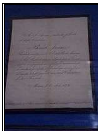
Acta de defunción de Benito Juárez levantada por el Registro Civil que él fundó.