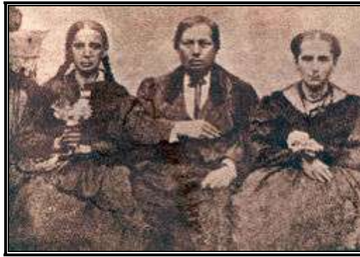
Benito Juárez en compañía de su hermana Nela (izquierda) y de su esposa Margarita.