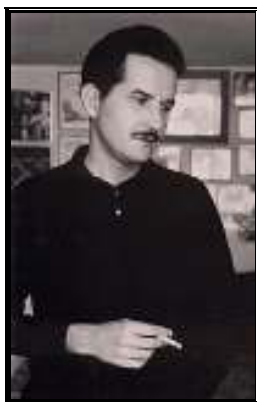
"Carlos Fuentes . 1960".

"Dicen que cada ser humano tiene detrás de sí treinta fantasmas. Ésta es la historia de dos de ellos, George en Londres en 1967 y el hereje medieval Siger de Brabante en la costa dálmata en 1360. En el instante en que éste recupera la memoria total, puede imaginar simultáneamente todas sus vidas anteriores y todas sus reencarnaciones. Pero seiscientos años después, un hombre contemporáneo tiene la misma experiencia: Te recuerdo y me recuerdas. Cumpleaños , a pesar de su nombre, es sobre todo una novela de los espacios superpuestos, como un palimpsesto gigante. El tiempo, en realidad, no cambia, es simultáneo. La relación afectiva, en cambio, es sumamente dinámica. Entre un 'te recuerdo' en 1360 y otro 'te recuerdo' en 1967, hay el amor que dice: 'me recuerdas, nos recordamos'".