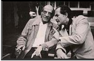
“Con Luis Buñuel en México (1979)”.